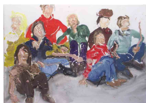
die tun nix